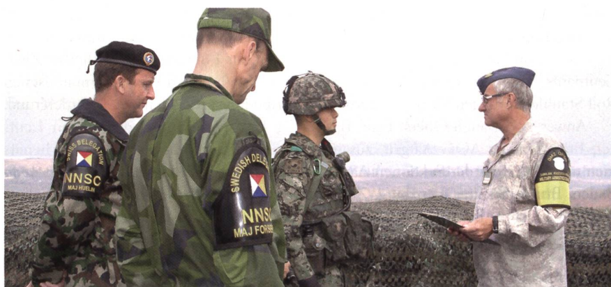
Major Paul Huelin mit seinem schwedischen Kollegen auf einem Wachtposten an der Demarkationslinie zwischen Süd- und Nordkorea.