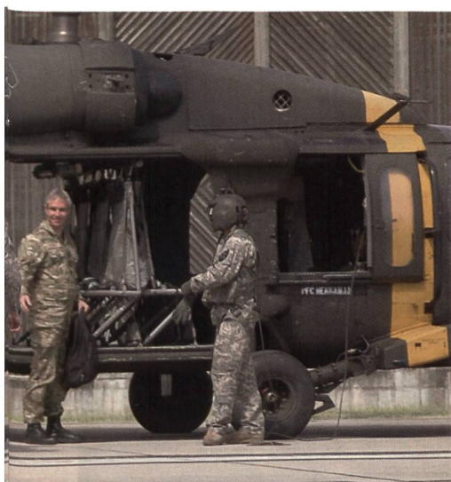
zusammen mit seinem schwedischen Kollegen United Nations Command.