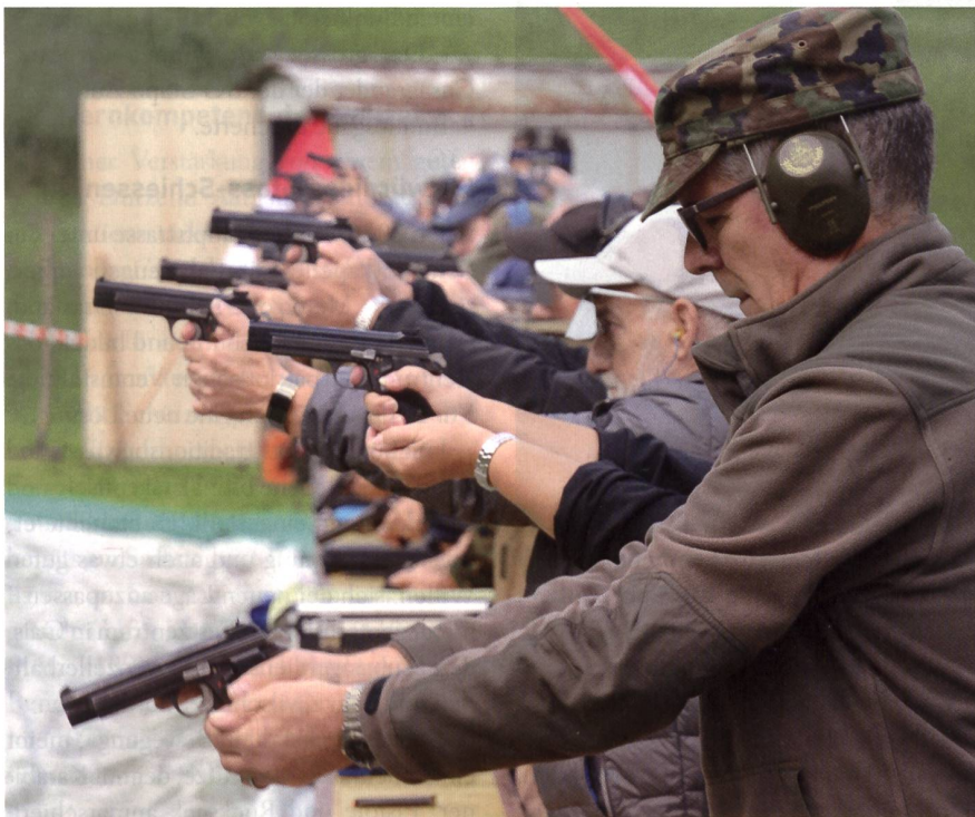
Treffsicher mit der Pistole.

glied Überfallschützenverbandes, der hier regelmässig 30 Punkte und 9 oder gar 10 Mouchen bucht – wir ziehen den Hut.