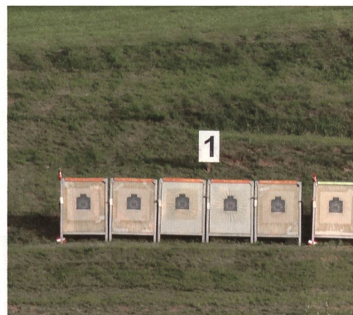
Ein Gewehr-Scheibenwald B5 am Stoss, sechs