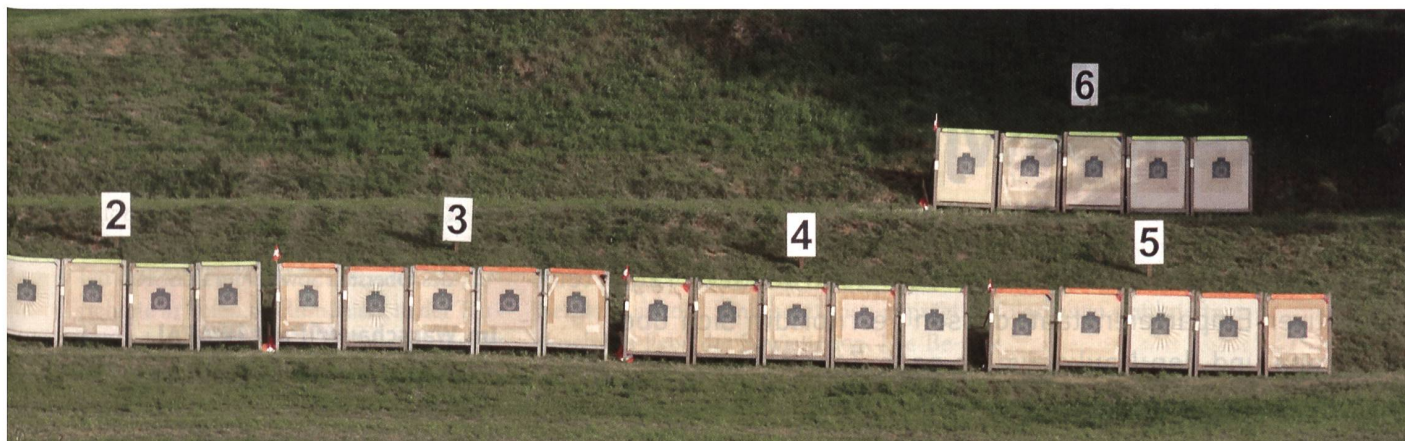
Blöcke zu fünf Scheiben; Distanz 240 Meter