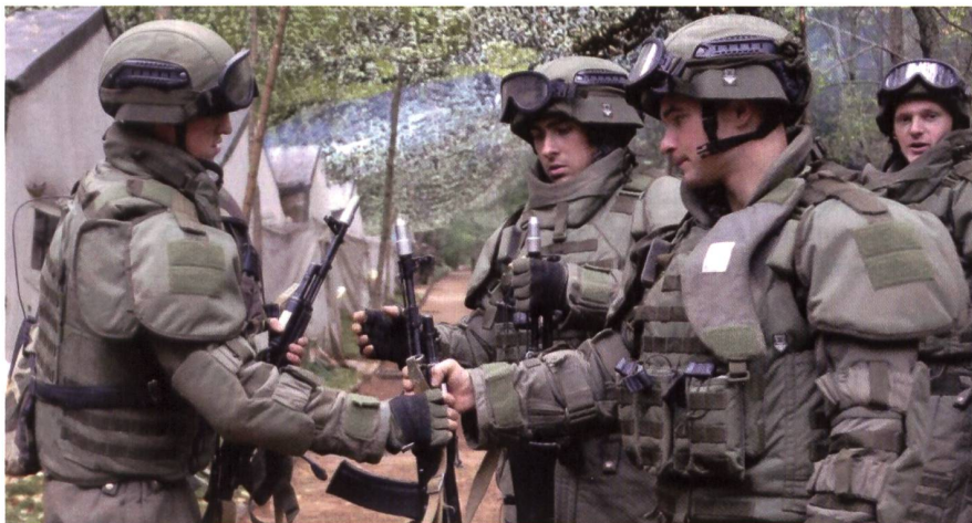
Fallschirmjäger in der neuen Kampfausrüstung der russischen Streitkräfte.