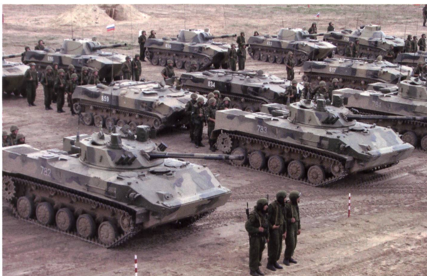
Teile einer russ. Luftlande-Kp. Von vorne: BMD-4-Spz; BTR-D; Mörser 2S9 NONA.