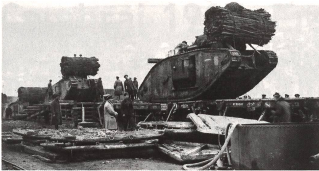
Mark IV Tank mit Faschinenbündel in Albert, Frankreich.