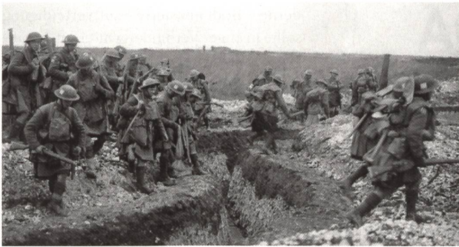
Gordon Highlanders bei Fontaines, Frankreich.