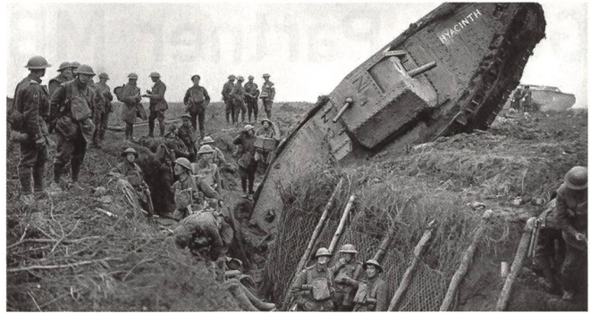
Bei Ribecourt steckengeblieben «männlicher» Mark IV Tank.

Hindernisse geschaffen und Brückengerät an den Saint-Quentin-Kanal gebracht.