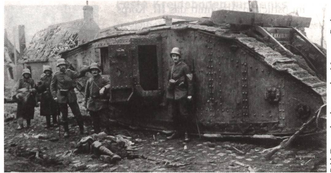
Bei Flesquières zerstörter «männlicher» Mark IV Tank.