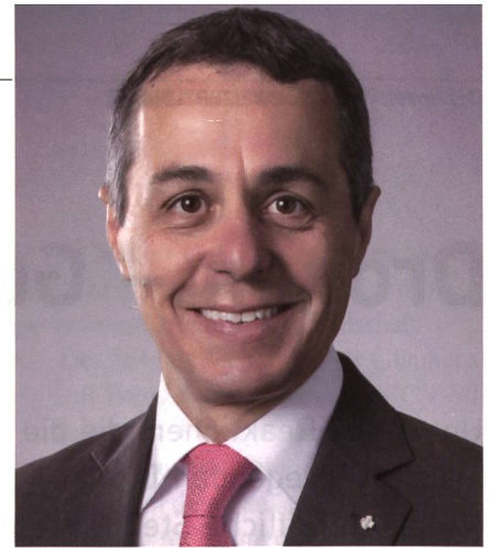
Der Bundesrat tagte am 8. November zum 2. Mal mit Bundesrat Ignazio Cassis.

Der BR hält am Grundsatz fest, wonach ausländische Lieferanten den Kaufpreis zu 100% durch die Vergabe von Aufträgen in der Schweiz kompensieren müs-