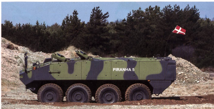
Die Schweizer Rüstungsbranche braucht den Export: Piranha-5 nach Dänemark.

weisen. Die Schweiz braucht eine eigene Rüstungsbasis. Und weil der Heimmarkt zu klein ist, dürfen die Rüstungsbetriebe gegenüber der EU-Konkurrenz nicht benachteiligt werden. fo.