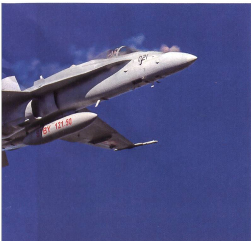
abgefangene Flugzeuge und Piloten.