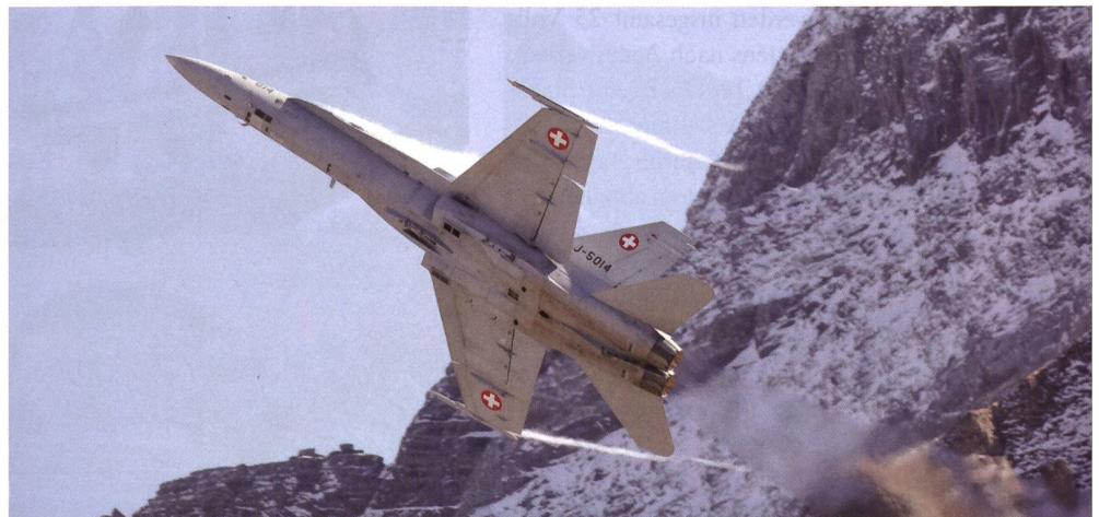
F/A-18 Hornet F-5014 schraubt sich in den Alpenhimmel.