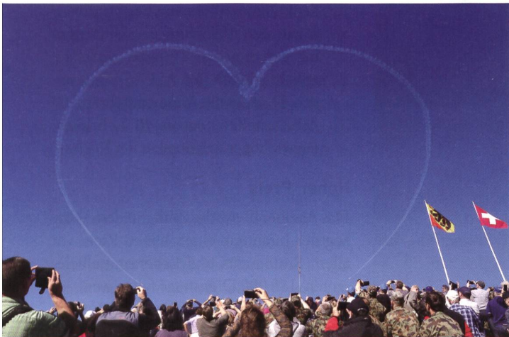
Begeisterte Zuschauer, blauer Himmel.