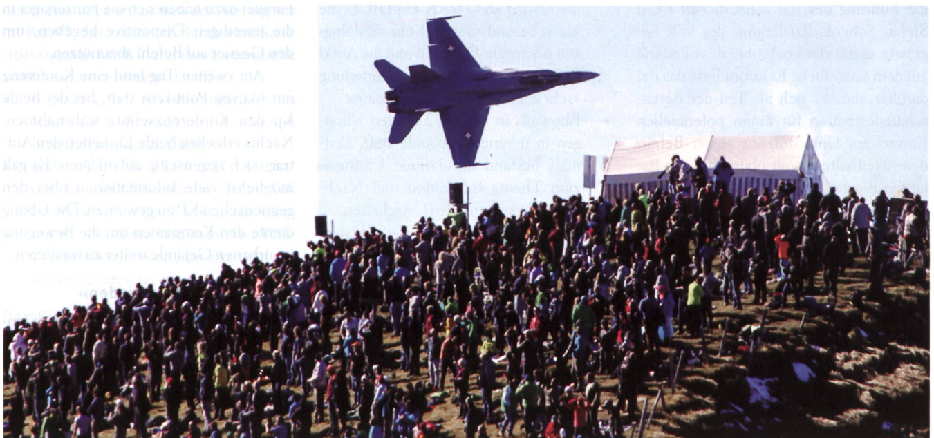
Ein F/A-18 zieht majestätisch über das Publikum hinweg – gemäss Fotograf Knuchel in einer Distanz von 150–200 Metern.