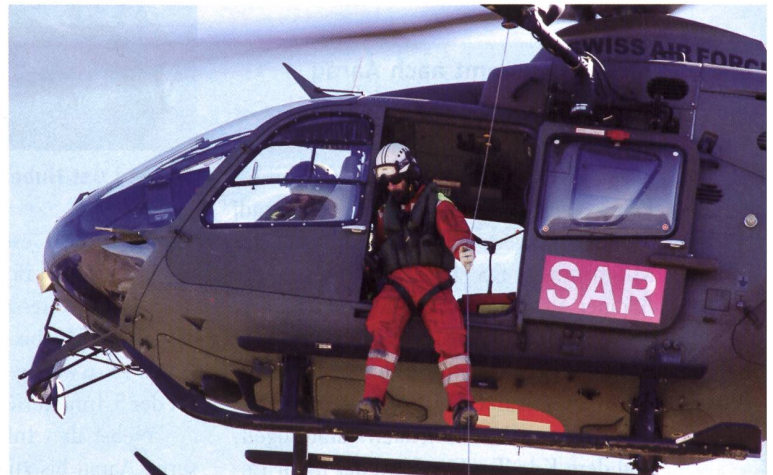
EC-635. Rettung mit Winde. SAR heisst Search and Rescue.