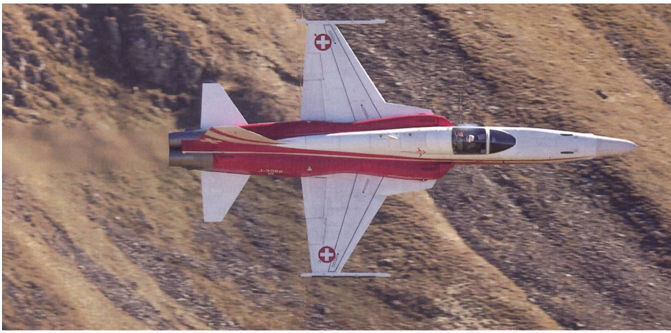
Ein Tiger der Patrouille Suisse, die das Publikum wie stets riesig begeisterte.