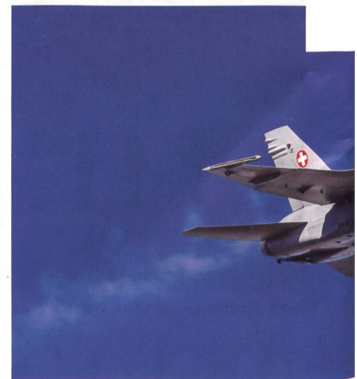
F/A-18. STBY 121.50 (mhz) = Funkfrequenz für