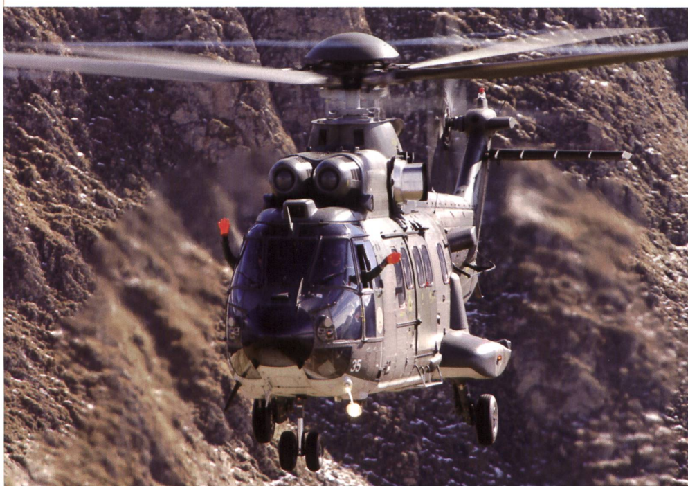
Ein Super-Puma vor der Kulisse der Berner Alpen.