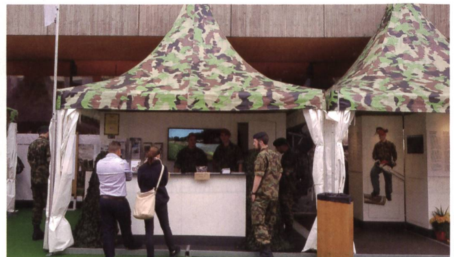
Attraktive Stände ziehen zivile und militärische Gäste an.