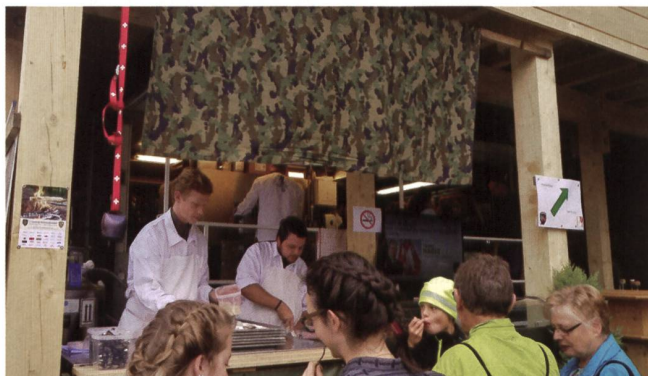
Für das leibliche Wohl sorgen die Militärköche.