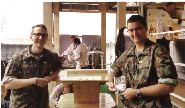
Guter Empfang. Mit Olma-Badge über dem Namensschild.