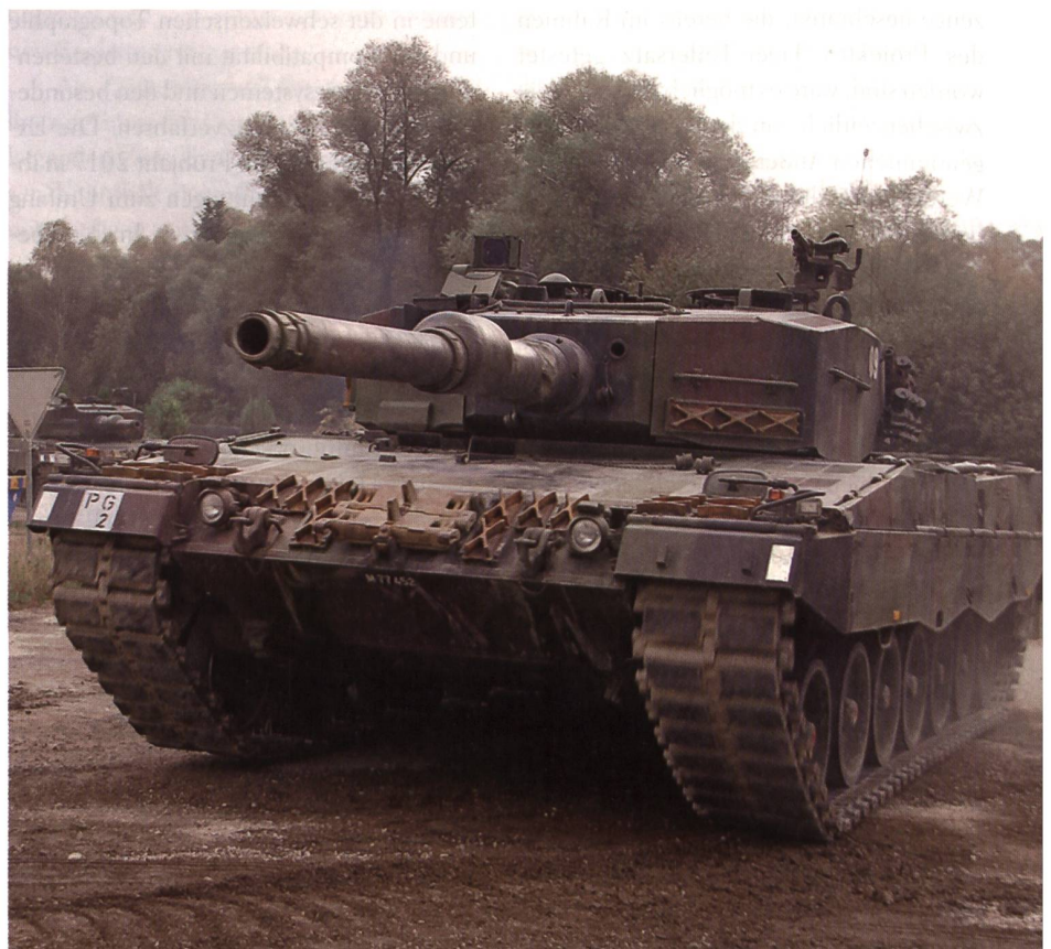
Panzerbataillon 29: Eindrehen zum Angriff auf das Kieswerk Bürglen/Thurgau.