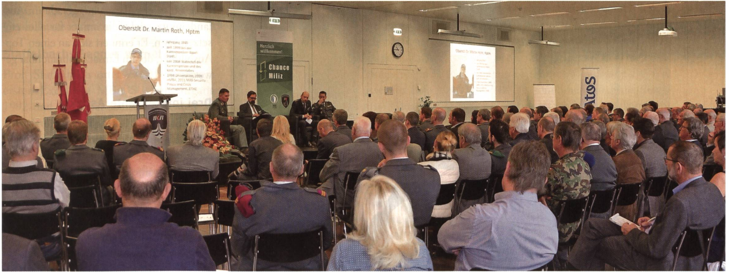
Über 200 Personen im AAL Luzern zum Thema Führung.