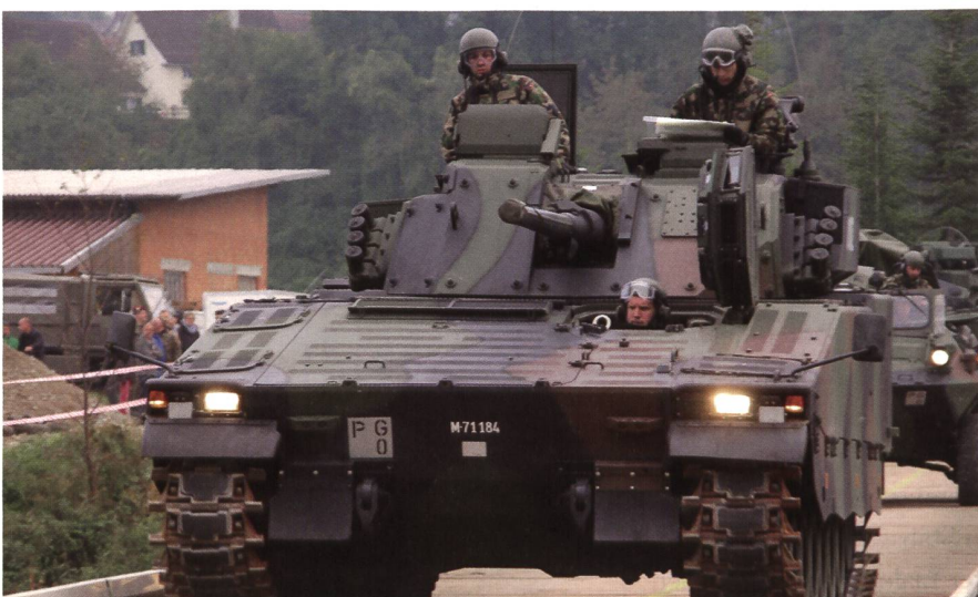
Pz Bat 29: Der Kommandopanzer 001 überquert eine Stahlbrücke. Das Bataillon gehört zur Stufe 2 und bleibt wie die Kompanien (Stufe 3) am FIS angeschlossen.