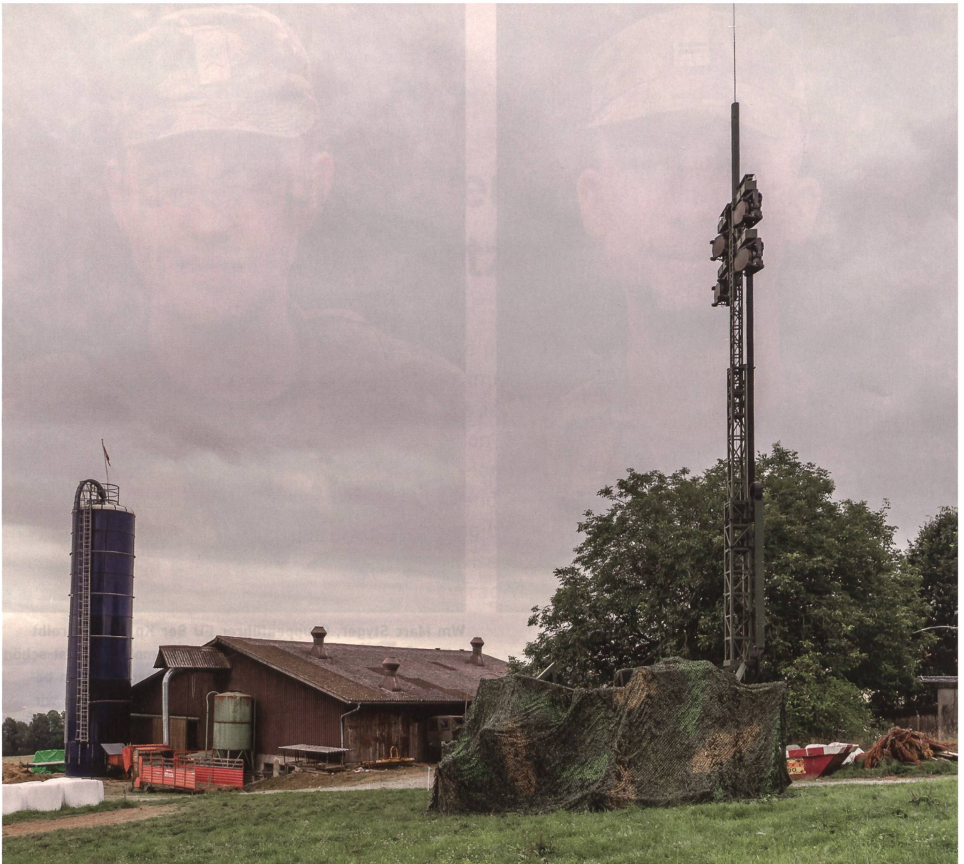
Dieser getarnte KOMPAK-Panzer dient unter anderem als Radio Access Point (RAP) und Richtstrahlknoten. Über ihn werden in der Übung «PILUM» drei Richtstrahl-Verbindungen feinverteilt.