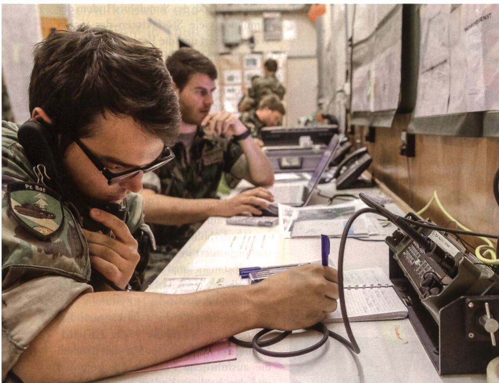
Bis zu 16 Telefonverbindungen kann das Kommando des Inf Bat 56 gleichzeitig nutzen.