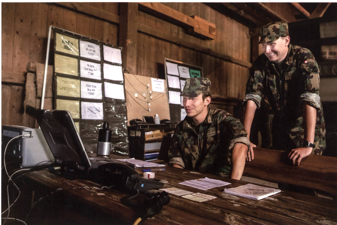
Einsatzstelle Telematik: Von hier aus werden die Netze geführt und überwacht.

Szenario: Ein Zugunglück im Raum Chiasso, nahe an der Grenze zu Italien. Chemiestoffe treten aus. Diverse militärische und zivile Einsatzkräfte üben die grenzüberschreitende Zusammenarbeit am abgelegenen Unfallort. Zwar verfügen alle Einsatzkräfte über ihr eigenes Kommunikationssystem - nur dank der FU Ber Kp 104 konnten diese aber auch untereinander kommunizieren und ihre Einsätze vor Ort koordinieren. +