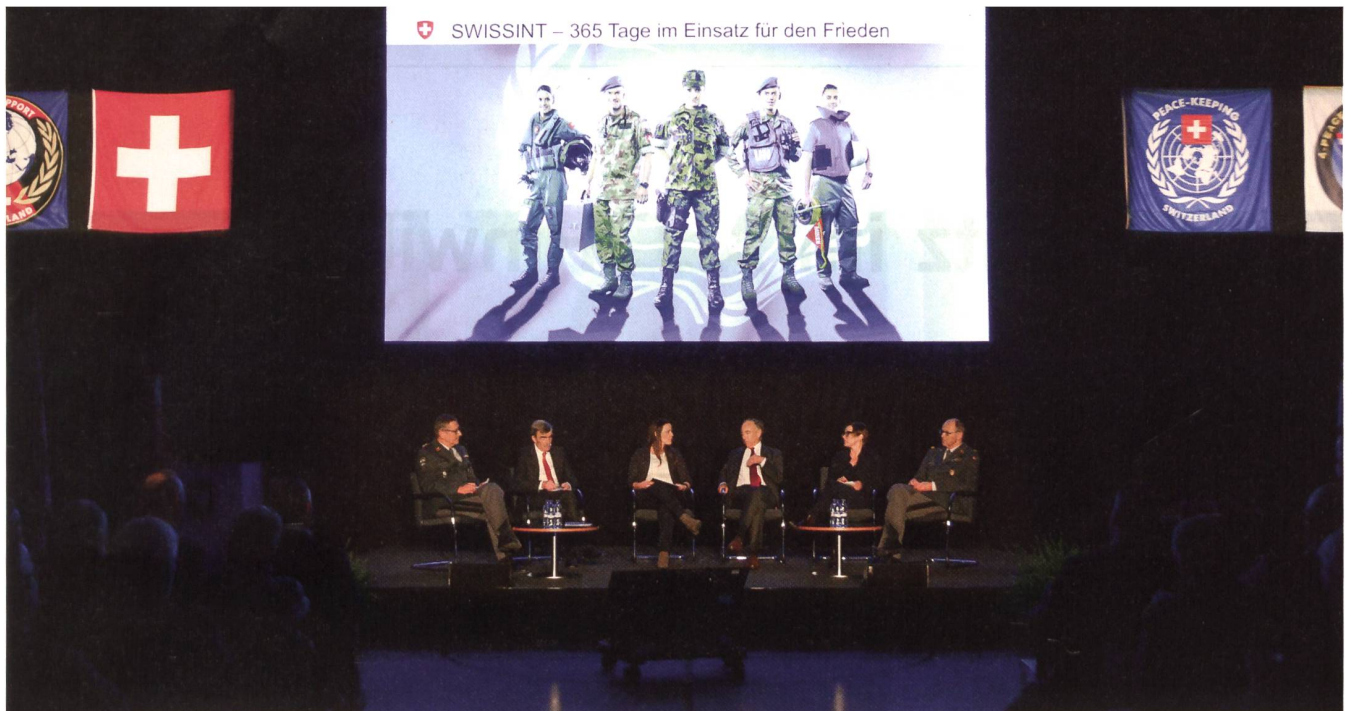
Podiumsdiskussion über die aktuelle und zukünftige Friedensförderung der Schweizer Armee im Ausland.