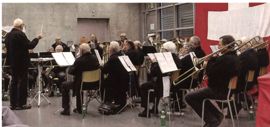
Die Thurgauer Veteranenmusik untermalte den Anlass musikalisch.