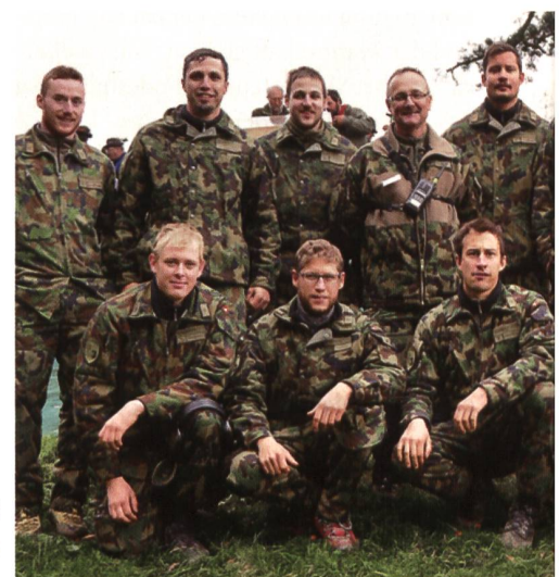
Das Sicherungsdetachement leistet ganze Arbeit.