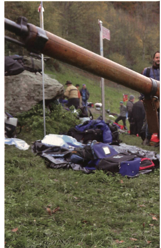
Demonstriert den Linksanschlag am Langgewehr