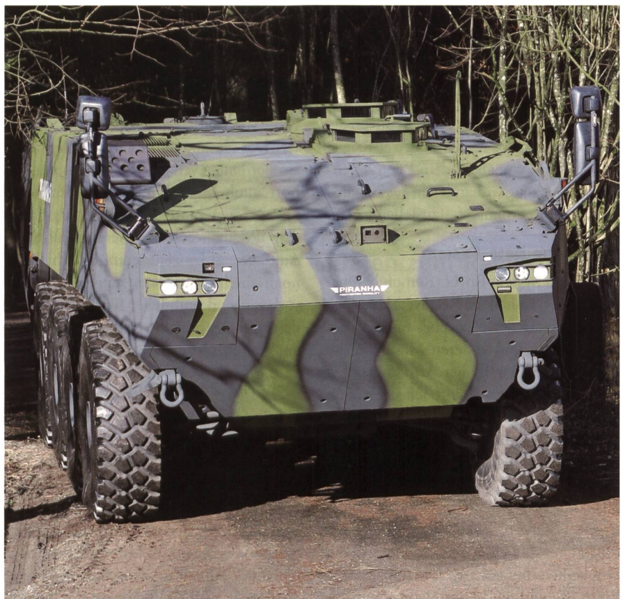
Der Piranha-5 schwang in Dänemark als Radpanzer gegen Kettenpanzer obenaus.