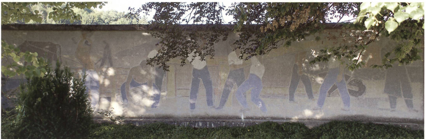
Die Gedenkstätte der 5. Division aus der Aktivdienstzeit des Zweiten Weltkrieges bedarf der Auffrischung.