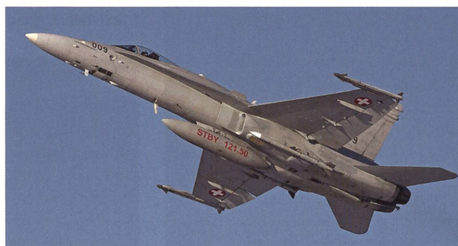
Der F/A-18 F-5009. Man beachte die scharfe Bewaffnung.