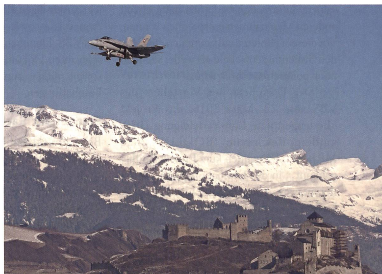
Immer wieder grandios: F/A-18 über Tourbillon und Valère.