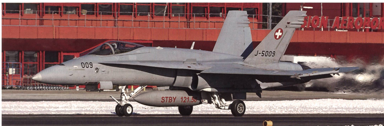
Der F/A-18 F-5009 auf dem Flugplatz Sion, dessen Tage als Militärflugplatz der Schweizer Luftwaffe leider gezählt sind.