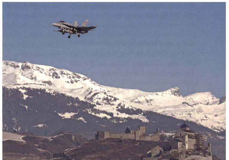
Immer wieder grandios: F/A-18 über Tourbillon und Valère.