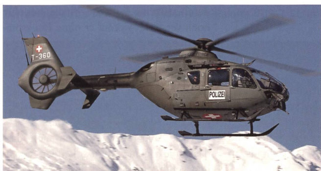
Der Transportheli EC-635 T-360, auch er im Polizei-Einsatz.