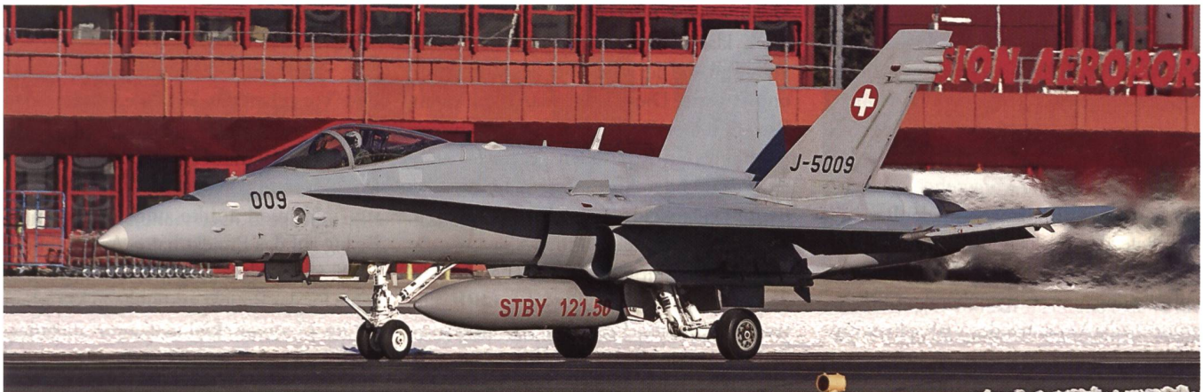
Der F/A-18 F-5009 auf dem Flugplatz Sion, dessen Tage als Militärflugplatz der Schweizer Luftwaffe leider gezählt sind.