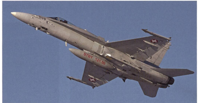
Der F/A-18 F-5009. Man beachte die scharfe Bewaffnung.