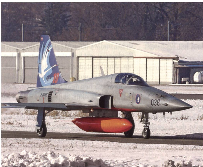
Der F-5 (J-3038), die Staffelmachine 19 (75-Jahr-Jubiläum).