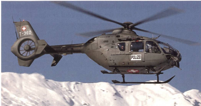
Der Transportheli EC-635 T-360, auch er im Polizei-Einsatz.