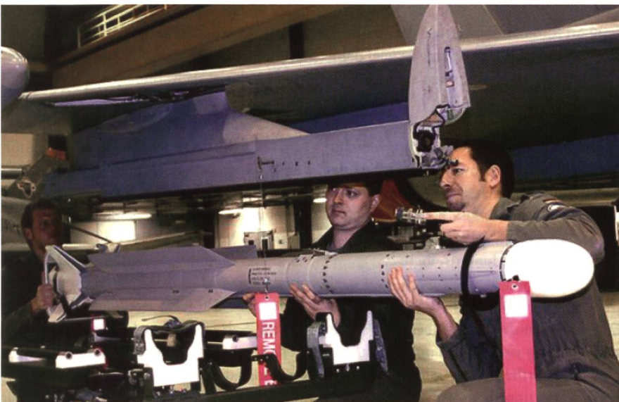
Montage der hundertfach erprobten IRIS-T-Rakete bei der deutschen Bundeswehr.