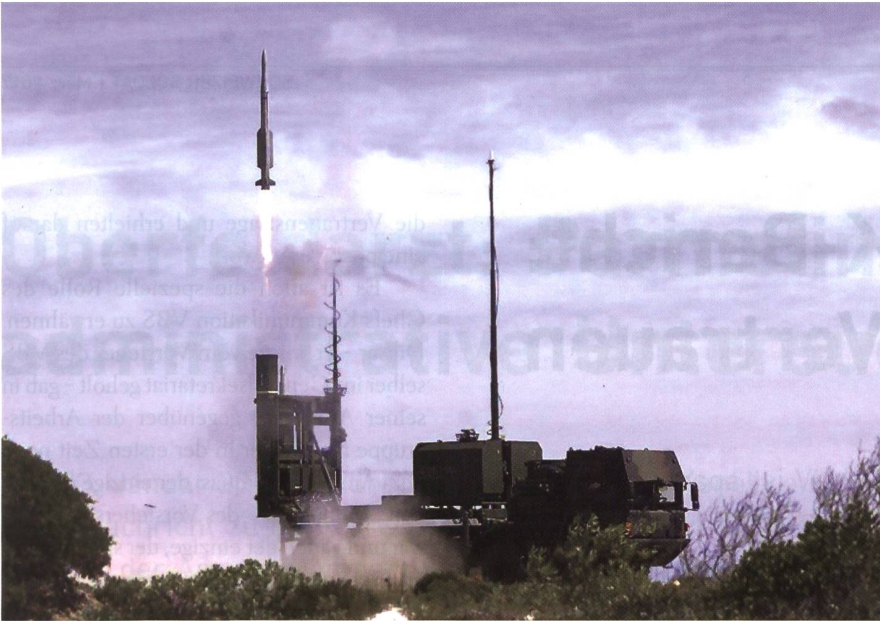
Der erfolgreiche Start einer Boden-Luft-Rakete IRIS-T SL in Overberg, Südafrika.