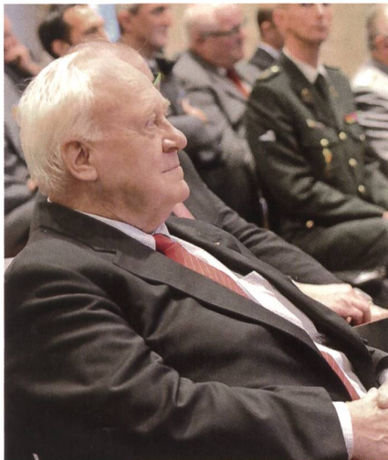
Aufmerksam wie immer: der ehemalige Generalstabschef Arthur Liener.