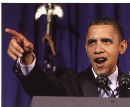
Prag, 2009: Obama fordert Abrüstung.

Demnach tragen in der Ebene von Salisbury die roten Angreifer in britischen Manövern russische Uniformen - und sie fahren auf russischen Panzern, was ungebührlich sei. Die Briten dementieren Shoigu zu 100%.