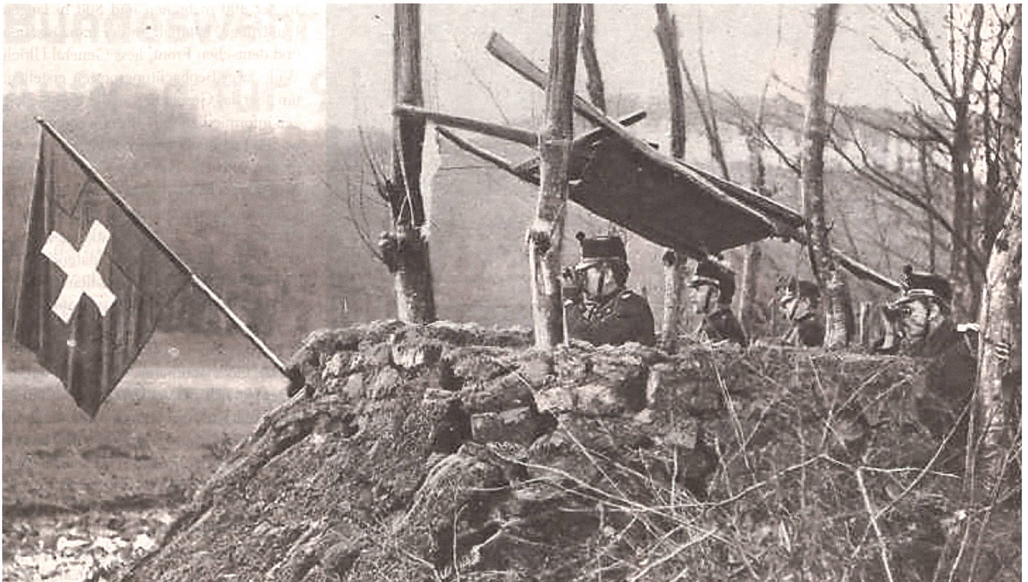
Der schweizerische Beobachtungsposten im Largin 1914.