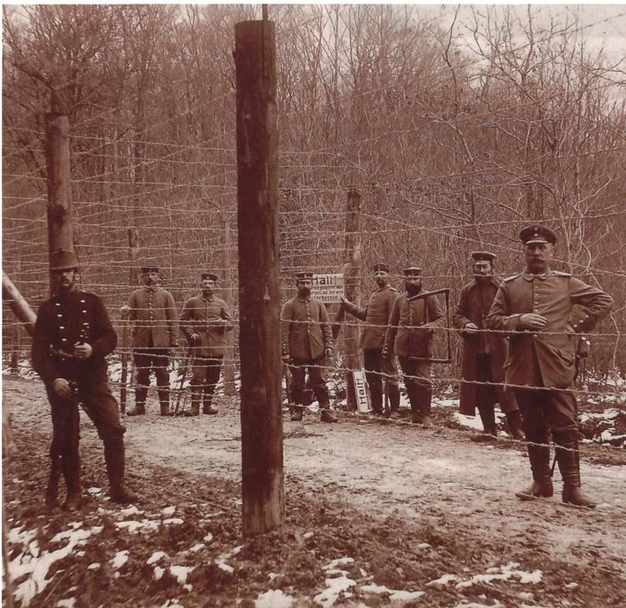
Schweizer Soldat am Grenzzaun mit deutschen Soldaten.