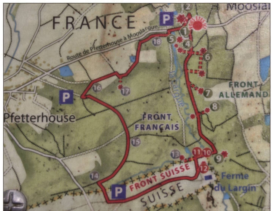
Überblick über den Lehrpfad «Kilometer Null» mit seinen 18 Posten im Largin.

Der ganze Rundgang beträgt 8 km. Bei der Markierung 10 wandert man über eine schöne, im Sommer 2013 erbaute Holzbrücke über das Flüsschen Larg zurück in die Schweiz. Jetzt hat man einen wunderschönen Ausblick über das Ried zum Larghof, dem einzigen Bauernhof in der Gegend. Hier kann man gut erahnen, wie exponiert und abgeschieden dieser Grenzzipfel im Krieg war. →