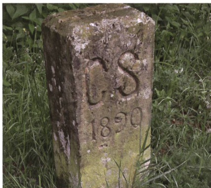
Grenzstein Schweiz-Frankreich (1890).