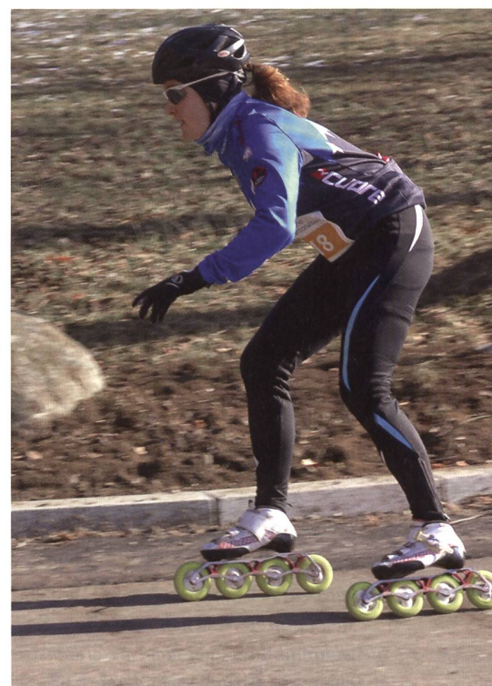
Inline-Skaterin in Aktion.

Eines ist klar: Ohne die Armee und ohne die Benützungsmöglichkeit der Kaserne Bülach wäre dieser Anlass gar nicht durchzuführen. Der organisierenden Zürcher Unterländer Offiziersgesellschaft und dem einsatzfreudigen OK helfen jeweils beim Aufbau, dem eigentlichen Wettkampf und dem Rückbau folgende ausserdienstliche Verbände, Vereine bzw. Rekrutenschulen: