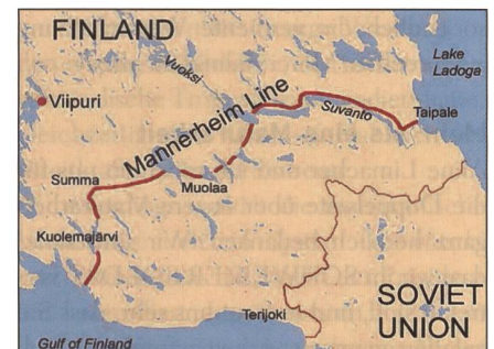
Rot die Mannerheim-Linie, Finnlands Hauptverteidigungslinie gegen Stalin.

Für jüngere Leser: Finnland wurde im Winter 1939 von einer überwältigenden sowjetischen Streitmacht, die über zahlreiche Panzer und Kampfflugzeuge verfügte, überfallen. Finnlands Armee leistete vier Monate lang erfolgreich Widerstand, bevor die Rote Armee einen Durchbruch er-