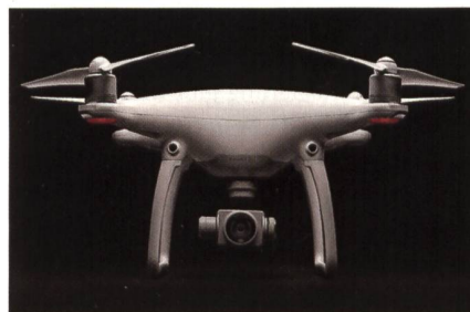
Phantom 4 von DJI, Shenzhen, China. Shenzhen gilt als Chinas Silicon Valley.

Bei der chinesischen DJI Phantom 4 handelt es sich um eine leistungsstarke Mini-