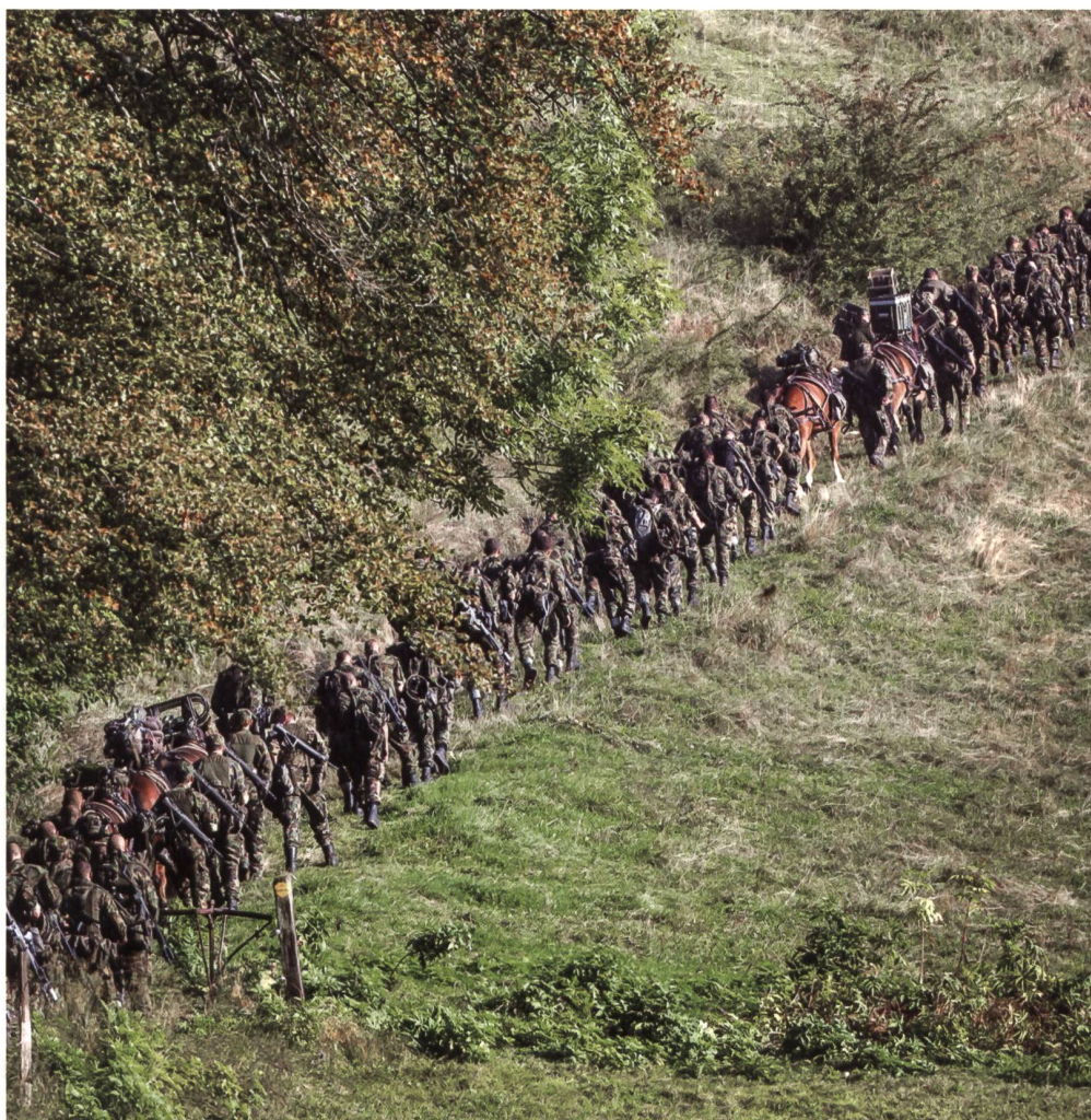
Das Nutt-Bild sagt mehr als 1000 Worte: Aufstieg, Zusammenhalt, Rückgrat der Armee.