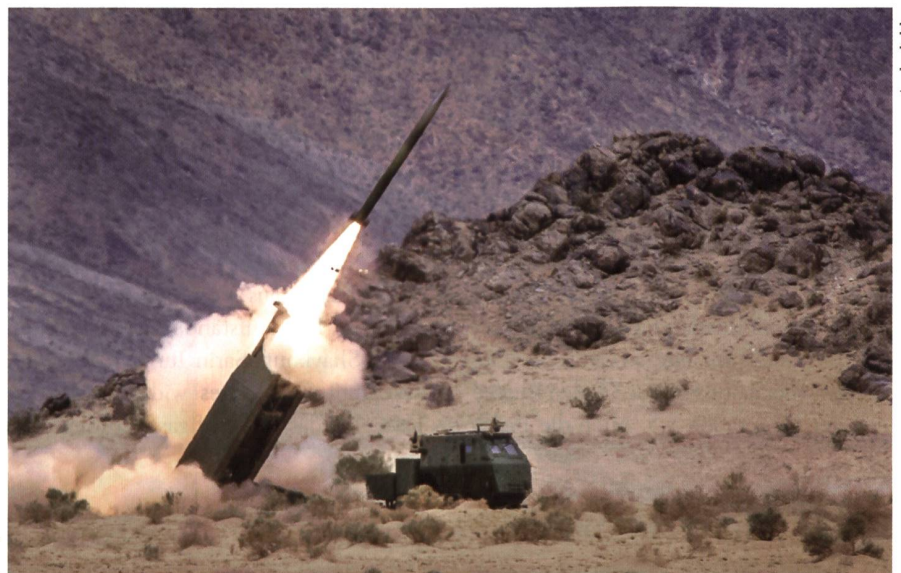
Der amerikanische Raketenwerfer 300-HIMARS. Ein Einzelschuss kostet 100 000 $.

Sollte auch West-Mosul fallen, wäre der ISIS im Irak auf seine letzte Bastion angewiesen: die turkmenische Grenzstadt Tal Afar. Was das bedeuten würde, kann man nur erahnen: Am Schutz von Tal Afar hat auch die Türkei ein waches Interesse. 🇨🇭