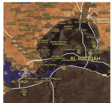
Lage 23.3.17. Der Tabqah-Damm ist gefallen, Stoss auf Flugplatz steht bevor.