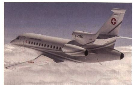
Der Bundesratsjet Falcon 900 EX T-785.

Im Jahr 2016 flog der LTDB mit Flugzeugen und Helikoptern 899 Stunden für den Bundesrat und die Departemente. Davon entfallen 637 Stunden auf den Bun-