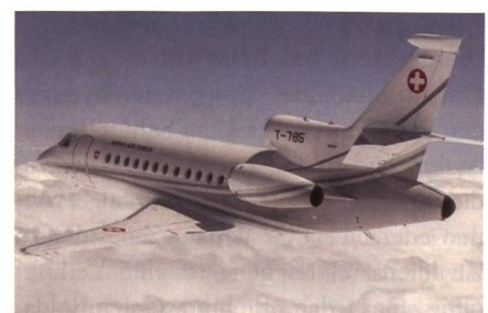
Der Bundesratsjet Falcon 900 EX T-785.

Im Jahr 2016 flog der LTDB mit Flugzeugen und Helikoptern 899 Stunden für den Bundesrat und die Departemente. Davon entfallen 637 Stunden auf den Bun-