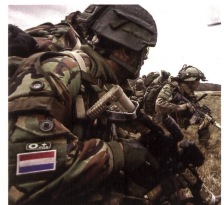
Selbstverständlich: Die Blutgruppe.

Die Niederlande hatten in Afghanistan lange Zeit Truppen im Kampfeinsatz. Die niederländischen Streitkräfte führen die