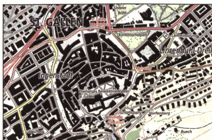
Der Kartenausschnitt St. Gallen...

Der Bedarf an Geodaten mit hoher Genauigkeit nimmt stetig zu. Erstmals wird nun eine neue Landeskarte vollautomatisch jährlich über die gesamte Schweiz erstellt und mit den aktuellsten verfügbaren