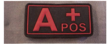
Klare Kennzeichnung der Blutgruppe.

Und schliesslich, wenn es wie vorliegendenfalls um «Bern» geht, muss man sich fragen, ob die rechtliche Grundlage sinnvoll ist oder ob man sich um eine Änderung /Anpassung bemühen soll. Aus der Diskussion innerhalb der Clausewitz-Gesellschaft schliesse ich, dass eine Änderung relativ einfach wäre –wenn man denn wollte. War kürzlich wieder mal im Impe-