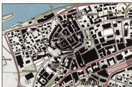
...und der Kartenausschnitt Aarau.

Die neue Landeskarte 1:10'000 ist in den grössten Zoomstufen des Geodaten-