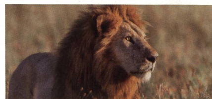
Krieg im Busch: Der tödliche Kampf zwischen Rangern und Wilderern