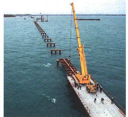
Die 19 km lange Krim-Brücke im Bau.

Parallel zur Brückeneröffnung verstärkte Russlands Führung die Streitkräfte auf der Krim: Sie stationierte dort weitere S-400-Boden-Luft-Raketen, die den Luftraum an der Grenze zur Ukraine kontrollieren.