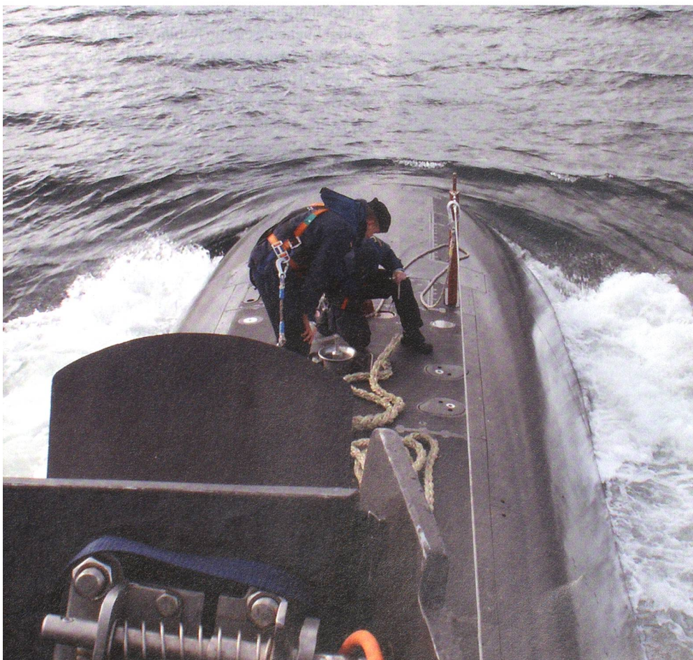
«U32» (S 182) auf Überwasserfahrt in der Ostsee. Zwei Matrosen auf dem Vorschiff bereiten die Leinen für das Festmachen vor.