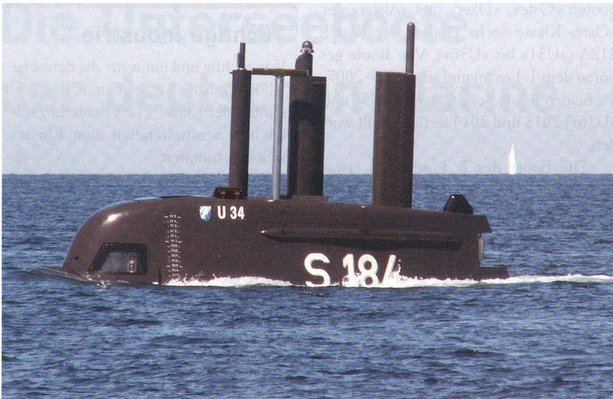
«U34» beim Auftauchen in der Ostsee, die meisten Masten sind ausgefahren.

verfügen über je sechs Torpedorohre im Bugsektor. Dereinst werden die Boote auch Unterwasserdrohnen einsetzen.