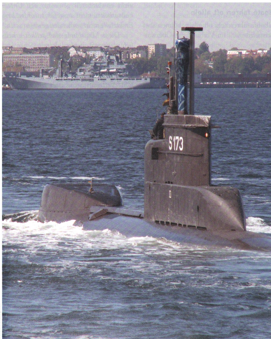
«U24» (S 173), ein Boot der Klasse 206A.

Die Hauptbewaffnung sind die neu entwickelten, drahtgelenkten schweren Mehrzweck-Torpedos des Typs DM2A4 «Seehecht» (Kaliber 53,3 cm; Länge 7 m), welche über mehrere Dutzend Kilometer - inoffiziell wird von bis zu 50 km gesprochen - bis in eine Tiefe von 300 m eingesetzt werden können. Der Torpedo ist batteriegetrieben, verfügt über einen Elektromotor und wird von zwei Schrauben angetrieben. Er ist eine Weiterentwicklung des DM2A3. Die Uboote der Klasse 212A