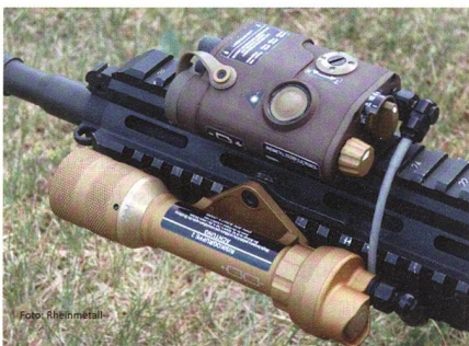
Laser-Licht-Modul für das neue «Sturmgewehr Spezialkräfte leicht».

Rheinmetall liefert Laser-Licht-Paket für Sturmgewehr Spezialkräfte leicht G95 der Bundeswehr. Das als G95 projektierte «Sturmgewehr Spezialkräfte leicht» alias HK416A7 erhält demnächst sein Laser-Licht-Paket. Der Auftrag umfasst die Herstellung und Lieferung von 1745 Sätzen des Laser-Licht-Paketes und hat einen Wert von rund fünf Millionen Euro. Die Lieferung beginnt im ersten Quartal 2019. Kernstück des Laser-Licht-Paketes ist das neu entwickelte und erstmals auf der Euro-