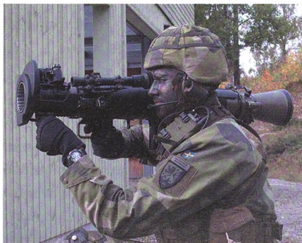
Carl-Gustaf M4 für Schweden.

Als fünftes Land führt Schweden die neueste Version des Mehrzweck-Waffensystems Carl-Gustaf M4 ein. Die 2014 erstmals vorgestellte tragbare Waffe wird von der Schulter abgefeuert und wiegt nur sieben Kilogramm. Als Munition für die rückstoss-