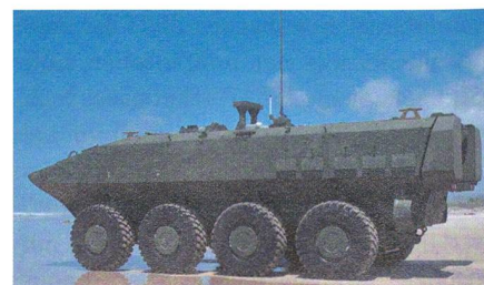
Neues Landungsfahrzeuge für das US Marine Corps.