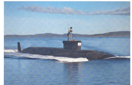
SSBN «Juri Dolgoruky».

Erstmals hat ein russisches strategisches Atom-U-Boot (SSBN) der «Borei»-Klasse vier Interkontinentalraketen (ICBM) in einem Salvantakt abgefeuert. Das SSBN