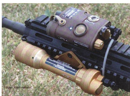
Laser-Licht-Modul für das neue «Sturmgewehr Spezialkräfte leicht».

Rheinmetall liefert Laser-Licht-Paket für Sturmgewehr Spezialkräfte leicht G95 der Bundeswehr. Das als G95 projektierte «Sturmgewehr Spezialkräfte leicht» alias HK416A7 erhält demnächst sein Laser-Licht-Paket. Der Auftrag umfasst die Herstellung und Lieferung von 1745 Sätzen des Laser-Licht-Paketes und hat einen Wert von rund fünf Millionen Euro. Die Lieferung beginnt im ersten Quartal 2019. Kernstück des Laser-Licht-Paketes ist das neu entwickelte und erstmals auf der Euro-