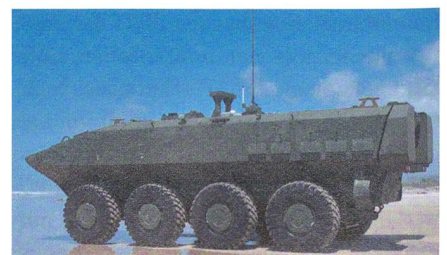
Neues Landungsfahrzeuge für das US Marine Corps.