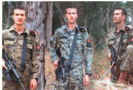
Israel prüft verschiedene Tarnmuster.

Die israelischen Streitkräfte beginnen derzeit einen Truppenversuch mit neuen Tarnuniformen. 330 Soldaten verschiedener Einheiten testen derzeit mehrere Uniformmodelle in drei verschiedenen Mustern. Ebenso gehen verschiedene Schnitte in die Erprobung. Die neuen Uniformen zeichnen sich nicht nur durch moderne