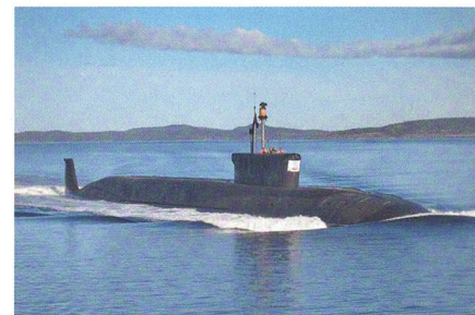
SSBN «Juri Dolgoruky».

Erstmals hat ein russisches strategisches Atom-U-Boot (SSBN) der «Borei»-Klasse vier Interkontinentalraketen (ICBM) in einem Salvantakt abgefeuert. Das SSBN