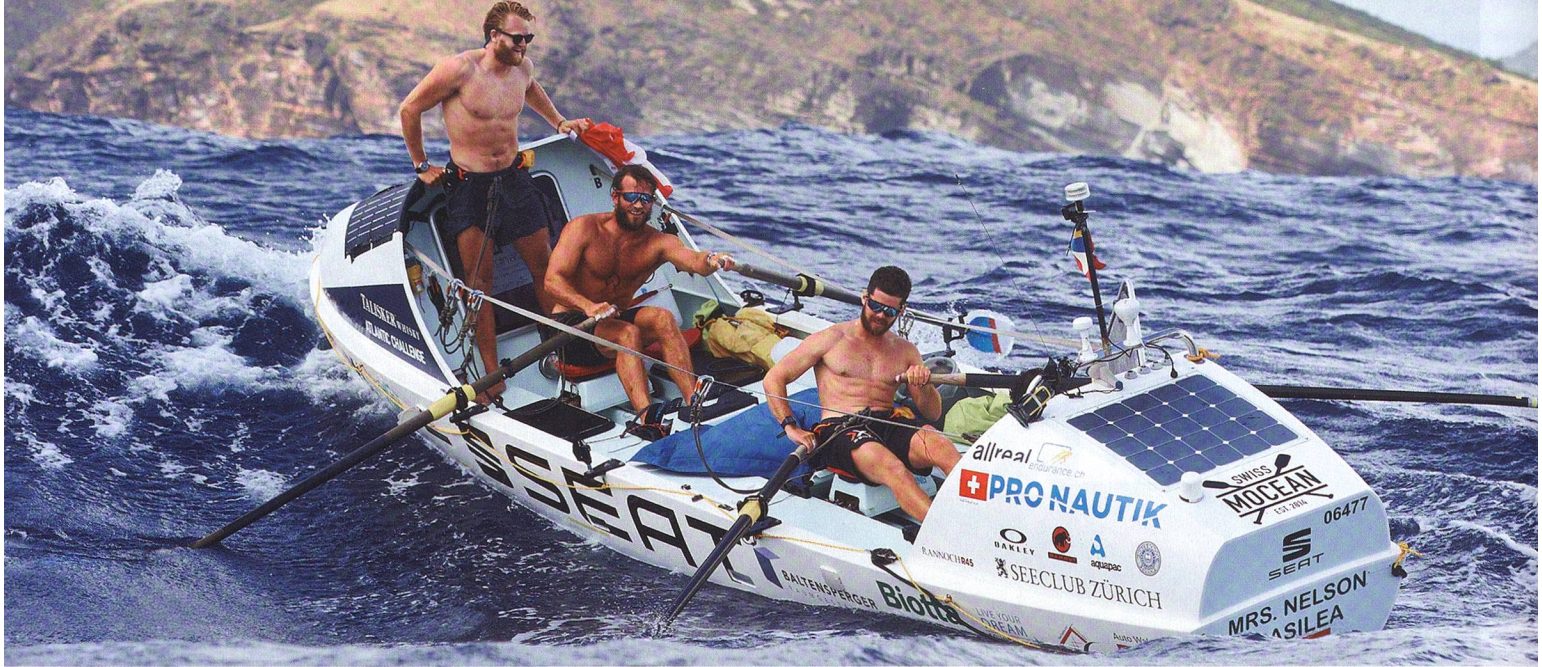
Im Zwei-Stunden-Takt lösten sich die Grenadiere in zwei Zweiertteams im Rudern ab.