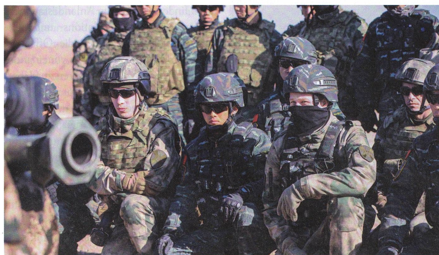
Chinesen (blau) instruieren russische Elitesoldaten (grün) an Chinas Waffen.