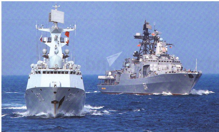
Chinas Fregatte «Huangshan», Russlands «Admiral Tributs».