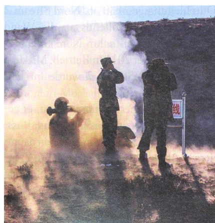
Im chinesischen Abschnitt: Der schulmässige Einsatz der Panzerfaust.