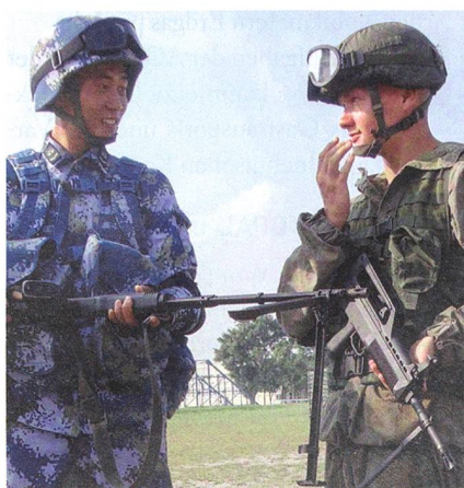
Soldaten zweier Grossmächte unter sich: Man zeigt sich die Waffen.

nähert sich unter russischer Führung ein starker Panzerverband dem Zielort, den die Jihadisten besetzt hatten. Die Jets werfen ihre Bomben ab und nehmen die Angreifer unter Feuer. Mehrere Wellen russischer und chinesischer Kampfhelikopter greifen ein. Dann zerschlagen die Panzer den Gegner; sie nehmen den Ort in Besitz.