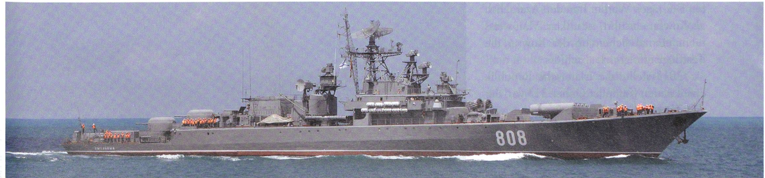
Die Raketenfregatte Pytlivy, in der russischen Nomenklatura Burevestnik-Klasse («Sturmvogel»), NATO: Krivak-II-Klasse.