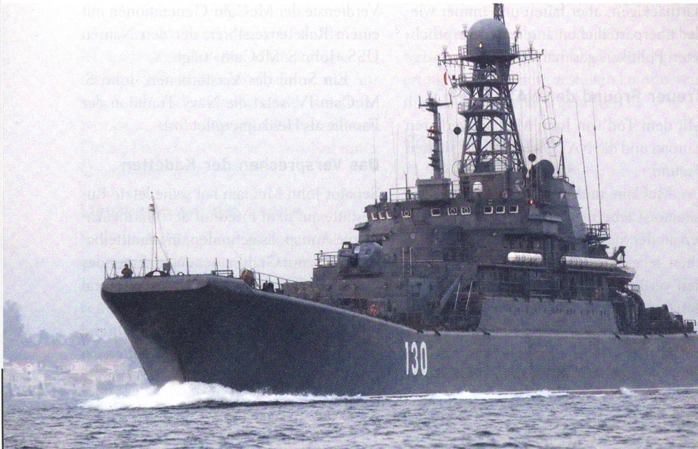
Landungsschiffe der russischen Seestreitkräfte passieren oft den Bosphorus, hier eine Einheit der Ropucha-Klasse, die nominell zur Baltischen Flotte gehört.

Auf dem Papier gehört die Provinz Idlib zur Deeskalationszone, die Russland, Iran und die Türkei im Herbst 2017 in Astana verhängten. Dennoch begannen Ende August die Iraner und ihre Verbündeten, ohne die