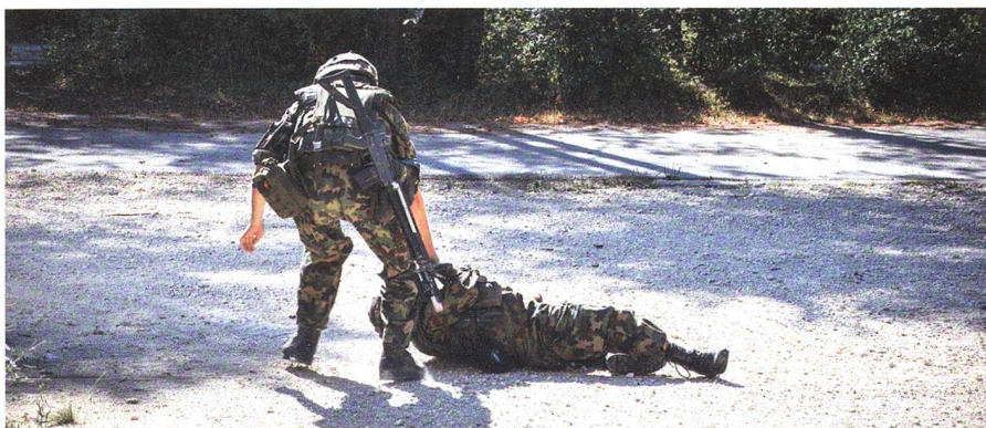
Mit Spezialprogramm schulte die Pz Kp 12/1 den Sanitätsdienst – Seiten 26–29.