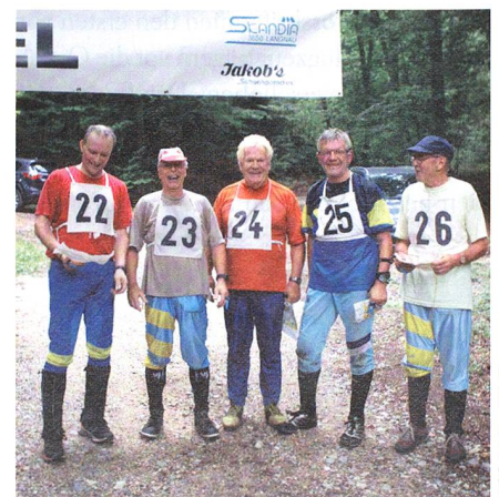
Veteranen nach erfolgreichem Skore-OL.