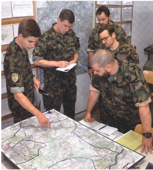
Eine Simulation der Zentralschule auf dem Führungssimulator der Generalstabsschule in Kriens.

den Weg zum Generalstabsoffizier einschlagen. Dies findet, zusammen mit der Ausbildung der Stabsangehörigen auf Stufe Grosser Verband und dem Training auf dem Führungssimulator, an der Generalstabsschule statt.