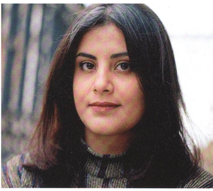
Die Regimekritikerin Hatloul, entführt.