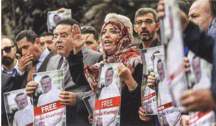
Kundgebung pro Kashoggi in Istanbul.