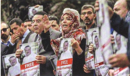
Kundgebung pro Khashoggi in Istanbul.