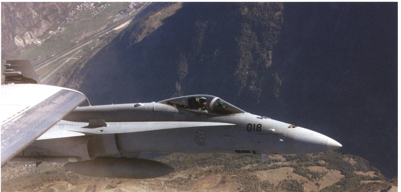
Der Pilot des F/A-18 J-5018 heftet sich an die verdächtige Maschine und nimmt Blickkontakt mit dem anderen Piloten auf.

In der aktuellen Phase der Umsetzung des Projektes Luftpolizeidienst 24 ist die Bereitschaft von 8 bis 18 Uhr. Am 20./21. November 2017 wurde eine Bereitschaft über die Nacht angeordnet. So ergab sich eine Gesamtbereitschaft von 36 Stunden. Die Luftwaffe verfolgt damit zwei Ziele: