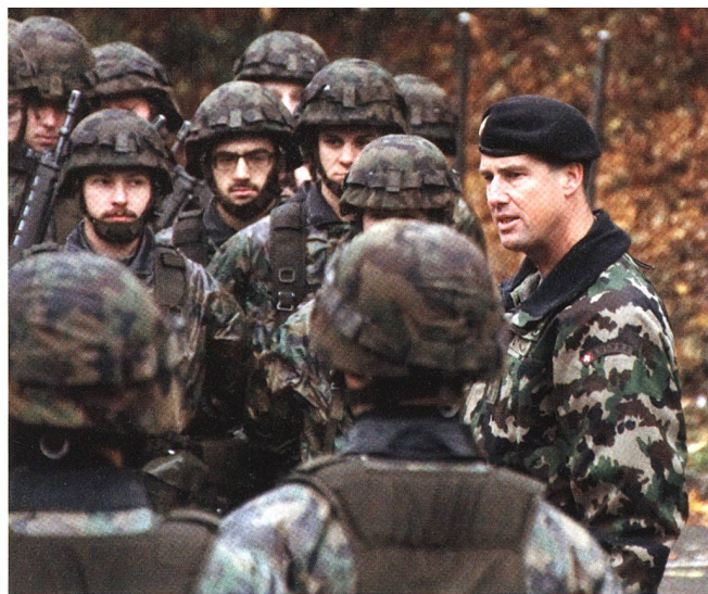
Inspektion bei strömendem Regen.