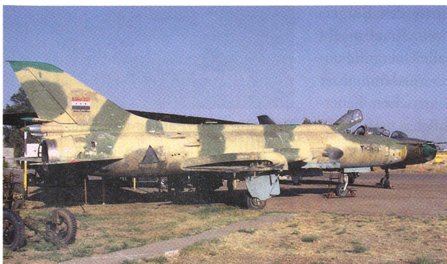
Suchoi-22 mit arabischer Kennung. Die Sowjetmaschine ist mit ihrer charakteristischen Nase gut zu erkennen.