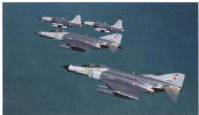
Türkische Jagdbomber F-4E Phantom. Dieser eindeutig definierte Typ ist schwer mit dem Su-22-Bomber zu verwechseln.