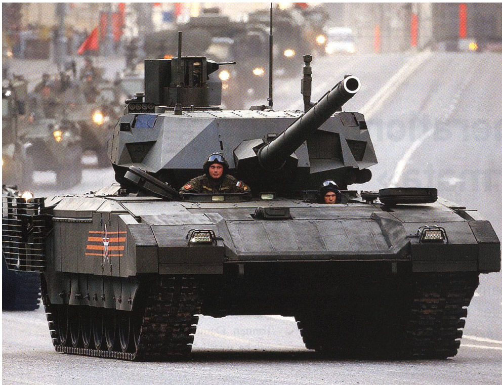
So wurde der T-14 schlagartig bekannt: Am 9. Mai 2015 auf dem Roten Platz.

seine Granate aus einer Distanz von 50 bis 150 Meter auf den Panzer schießt, so schützt das System den Panzer nicht. Es tritt gar nicht in Funktion.