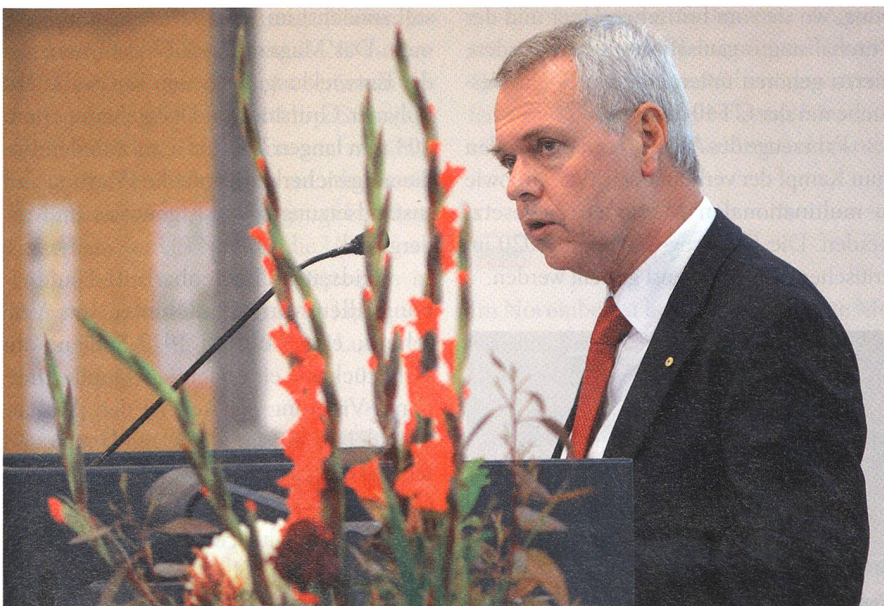
Der Australier Kym Osley, früher Air Vice-Marshal, berichtet vom F-35.