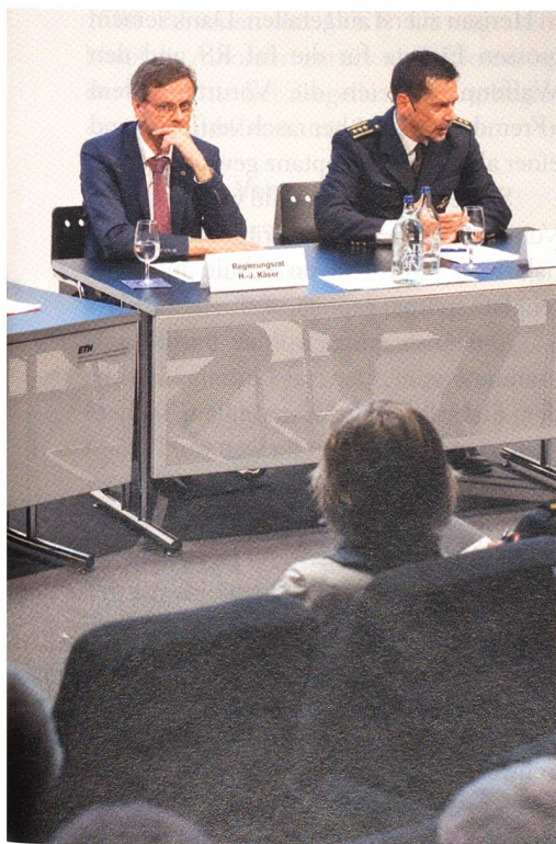
ETHZ, Regierungsrat Hansjörg Käser, Polizei-