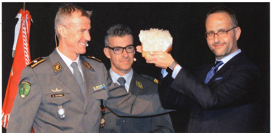
Consigliere di governo Norman Gobbi erhält als Geschenk einen Gotthardkristall.