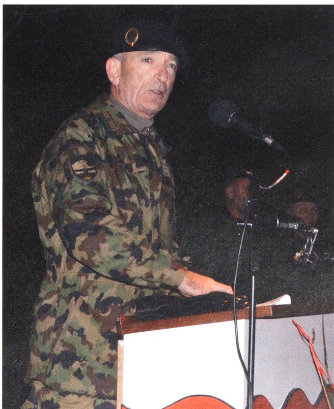
Br Langel, ein grosser Panzergeneral, tritt nach 4 Jahren ab.