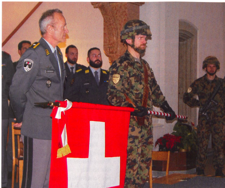
Br Niederberger und der Fähnrich sind zur Brevetierung bereit.