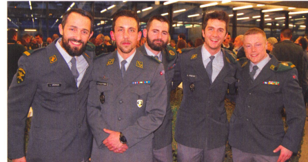
Es lebe die Infanterie mit ihrem Lehrverband und allen Waffenplätzen.