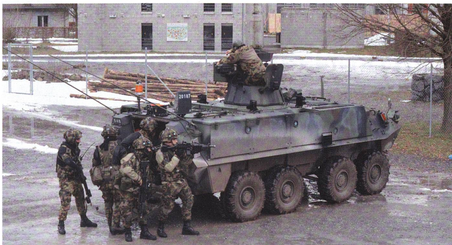
Das Inf Bat 61 und Durchdiener üben den Ortskampf – Seiten 25–27.