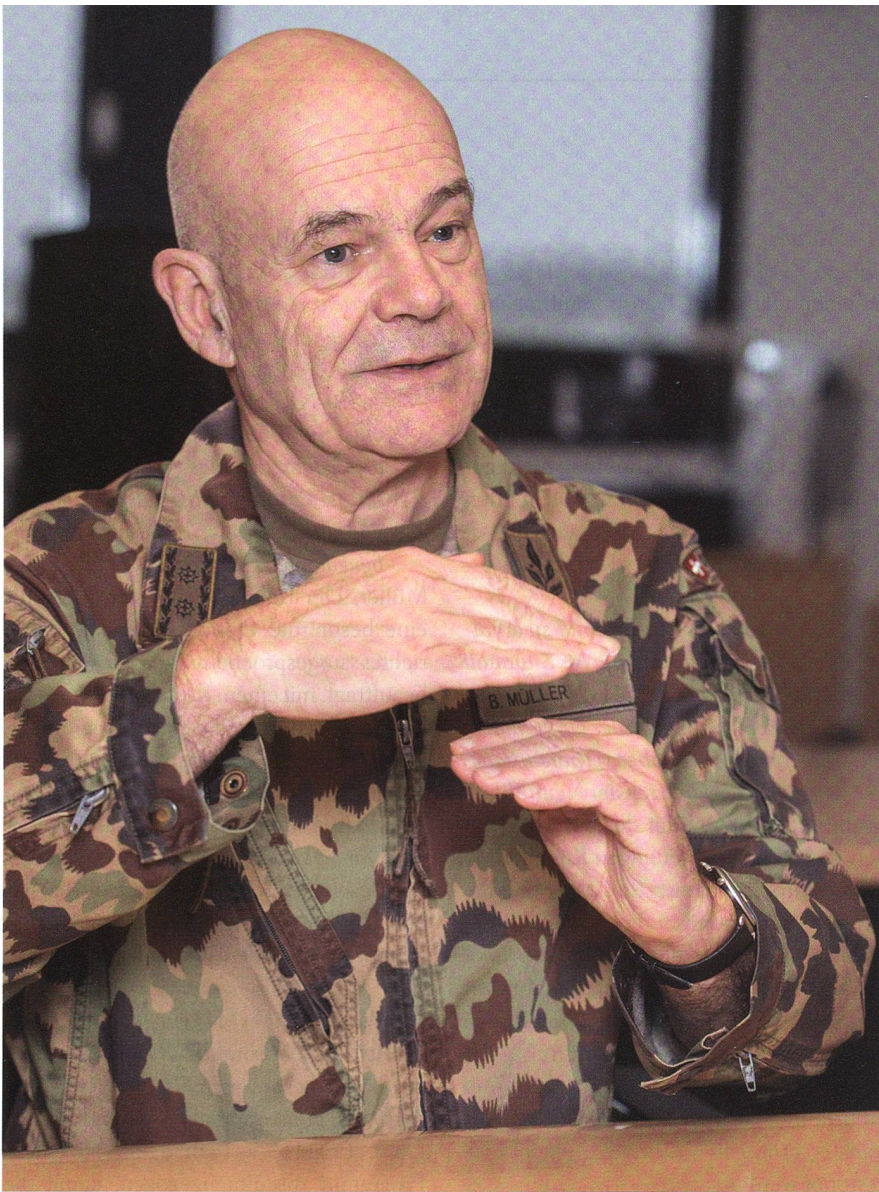
Div Müller: «Noch nicht über Typen reden.»

dazu, dass schon jetzt sogar von früheren Höheren Stabsoffizieren, der F-35 öffentlich forciert wird? Das schadet doch?